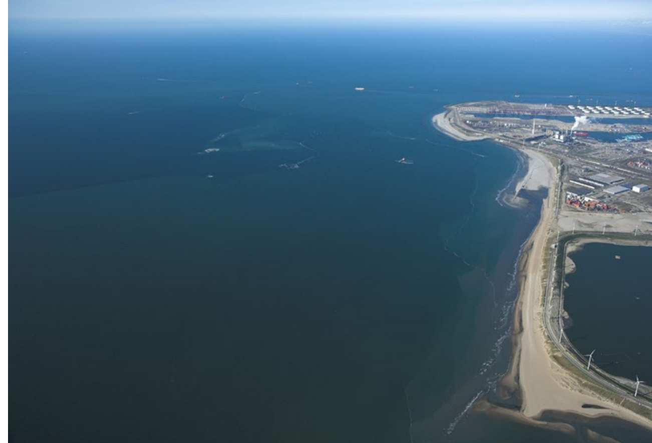
^ Situatie in januari 2009.

Hoewel het vertrouwen tussen de onderhandelingspartners in het najaar van 2007 groeit, is de monitoring van de doelstellingen een heet hangijzer. Gaat het om zelfmonitoring door de zes betrokken overheden en het Havenbedrijf, of gaat het om onafhankelijke monitoring door een extern bureau. De natuur- en milieuorganisaties maken zich sterk voor externe monitoring en dit wordt opgenomen in Visie en Vertrouwen. DCMR komt al snel in beeld als uitvoerder. DCMR is weliswaar een overheidsdienst, maar wordt algemeen gezien als een deskundig en zelfstandig opererend bureau, dat ook kan bogen op vertrouwen vanuit de milieuorganisaties. Sinds de start van de Tafel van Borging maakt DCMR jaarlijks een rapport over de stand van zaken van alle 35 doelstellingen. Het rapport wordt door de bevoegde gezagen aangeboden aan de Tafel van Borging. Gezien de vrijwilligheid van de elf extra verplichtingen die het Havenbedrijf is aangegaan, is bij het rapporteren over de realisatie hiervan wel sprake van zelfmonitoring door Havenbedrijf Rotterdam. Dit was voor de maatschappelijke organisaties (natuur- en milieuorganisaties en bedrijfsleven) aanvaardbaar.