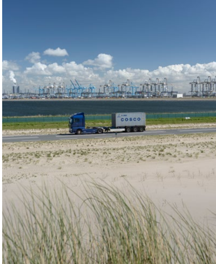
^ De containercapaciteit van de Rotterdamse haven is verdubbeld.

De Tafel van Borging functioneert in de praktijk zoals bedoeld: dicht bij de oorspronkelijke doelstellingen van de partijen. Er zijn geen statutaire wijzigingen doorgevoerd, er zijn geen wijzigingen