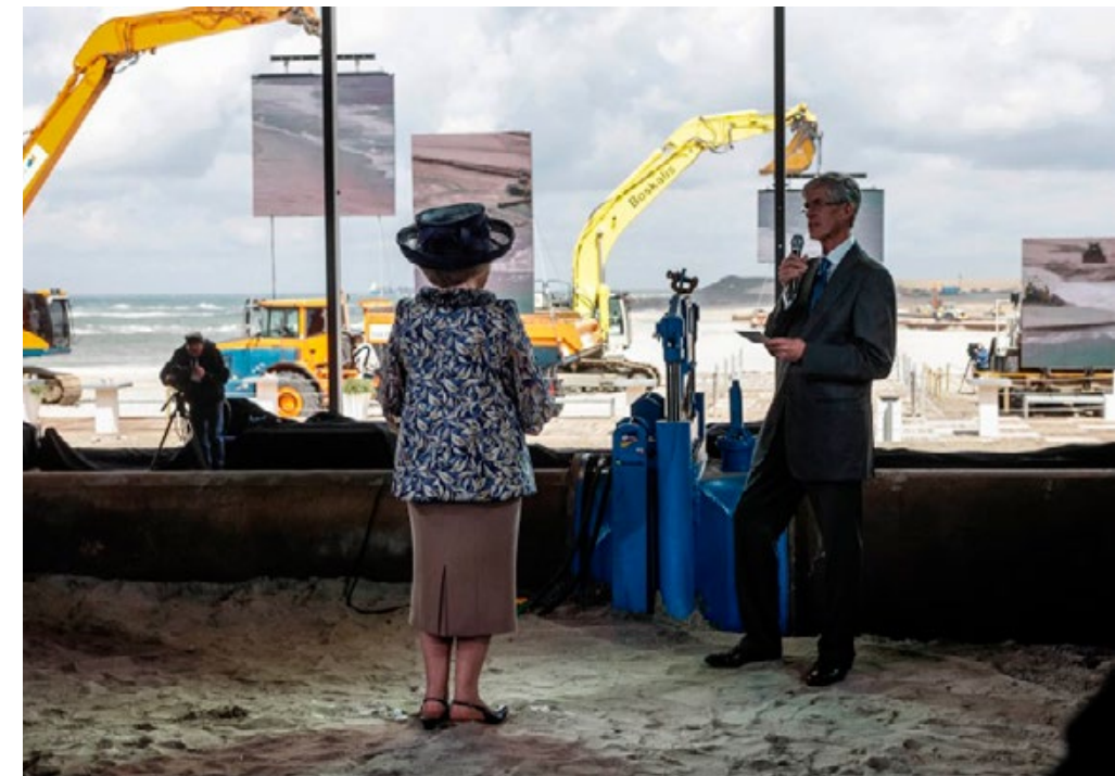
^ Sluitingsceremonie met koningin Beatrix.

“Die vraag wordt natuurlijk vaker gesteld; eigenlijk zou ik het met de kennis van nu niet anders doen. Het ging gewoon goed en we hebben er veel van geleerd. Een waardevolle les voor mij zelf is dat je ook met de grootste criticasters mogelijkheden kunt creëren voor een gesprek over de inhoud. Het is goed zaken doen met NGO's. Ze handelen vanuit een oprechte wil om de situatie te verbeteren. Hun belang is helder en authentiek.”