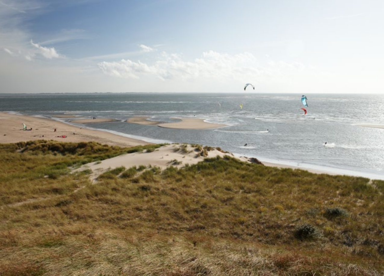
^ PMR: Investeren in economie, bedrijvigheid, leefbaarheid, recreatie en natuur.

sprake van een gezamenlijke nieuwsgierigheid naar het ontwikkelen van borging.